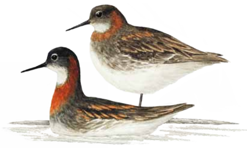
Öðinshani Phalaropus lobatus EN: Red-necked Phalarope FR: Phalarope à bec étroit NO: Svømmesnipe ÞY: Odinshühnchen