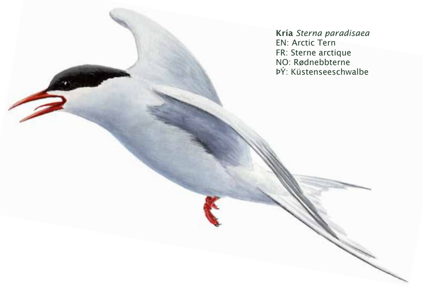
Kría Sterna paradisaea EN: Arctic Tern FR: Sterne arctique NO: Rodnebbterne ÞY: Küstenseeschwalbe