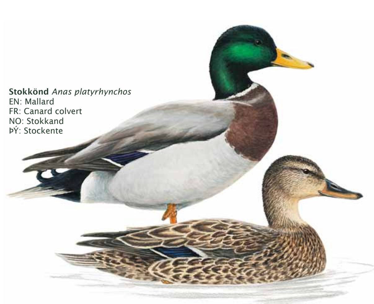
Stökkönd Anas platyrhynchos EN: Mallard FR: Canard colvert NO: Stokkand ÞY: Stockente