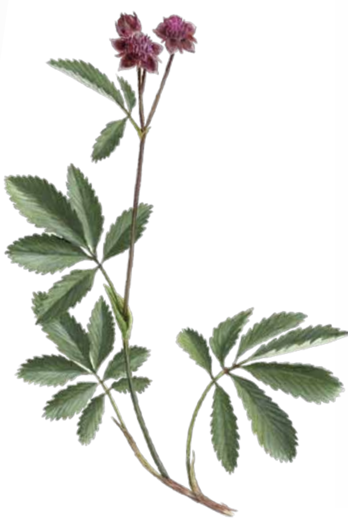
Engjarós Potentilla palustris EN: Marsh Cinquefoil FR: Comaret NO: Myrhatt ÞY: Sumpf Blutaue