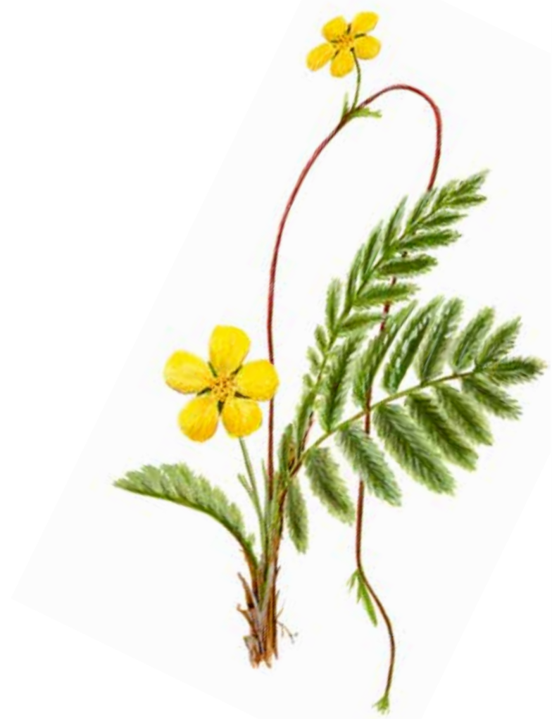
Tágamura Potentilla anserina EN: Silverweed FR: Potentille des oies NO: Gåsemure ÞY: Gänse-Fingerkraut