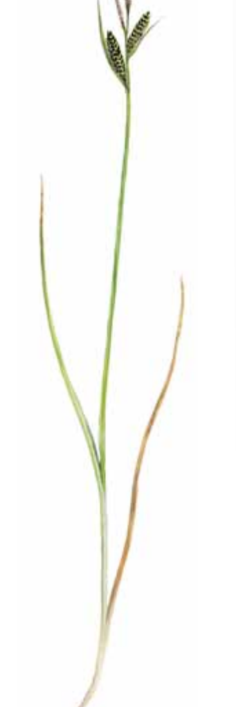
Mýrastör Carex nigra EN: Common Sedge FR: Carex nigra NO: Slättestarr ÞY: Schwarz-Segge