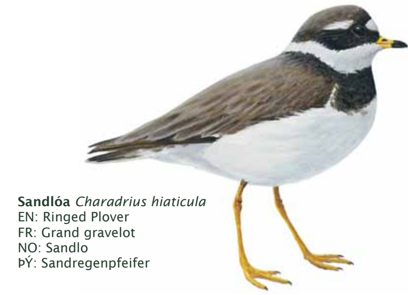
Sandlóa Charadrius hiaticula EN: Ringed Plover FR: Grand gravelot NO: Sandlo ÞY: Sandregenpfeifer