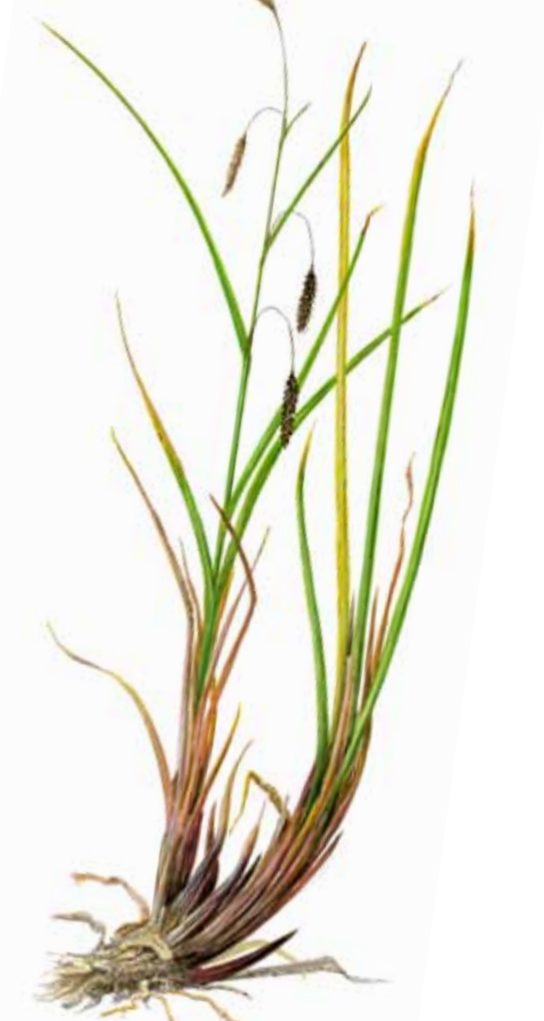
Gulstör Carex lyngbyei EN: Lyngbye's Sedge FR: Carex de Lyngbye NO: Gjölstar ÞY: Lyngbyes Segge