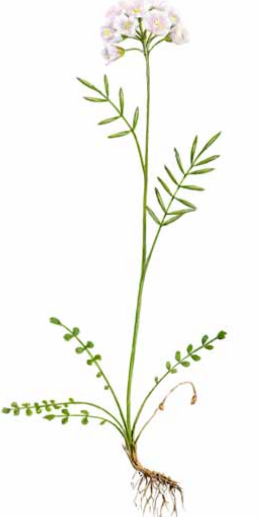
Hrafnaklukkan Cardamine pratensis EN: Lady Smock FR: Cardamine des prés NO: Engkarse ÞY: Wiesen-Schaumkraut