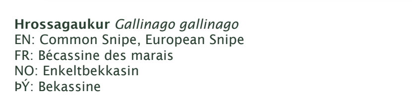
Hrossagaukur Gallinago gallinago EN: Common Snipe, European Snipe FR: Bécassine des marais NO: Enkeltbekkasin ÞY: Bekassine