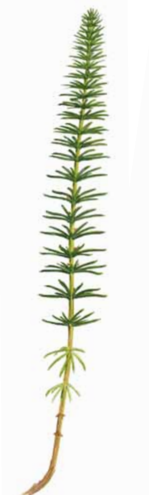
Lófótur Hippuris vulgaris EN: Mare's-tail FR: Peese d'eau NO: Hesterumpe ÞY: Tannenwedel